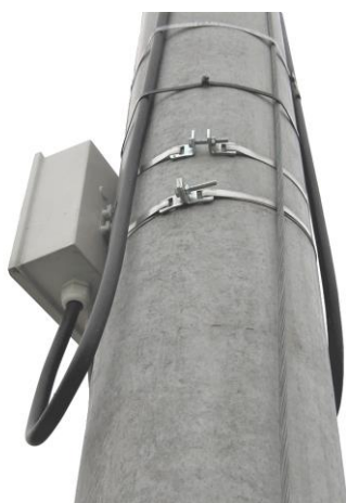
aplikácia setov KPRU16 TWIN