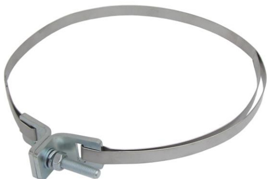
set KPRU16 TWIN

montážny set vhodný pre inštaláciu zariadení ( konzoly, dopravné značky ap. ) na stĺpy alebo stožiare s väčším priemerom