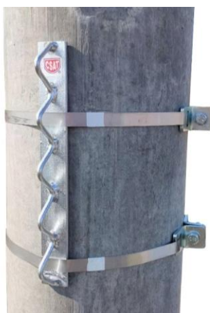
montáž DNK250 pomocou setov KPRU16 TWIN