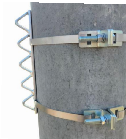
aplikácia KPRU16 TWIN ( montáž DNK250 )