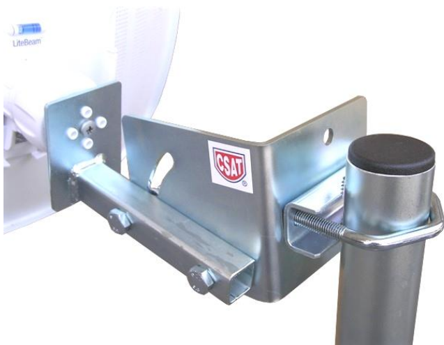
KLBE120 + VBZ3 na trubke TPM