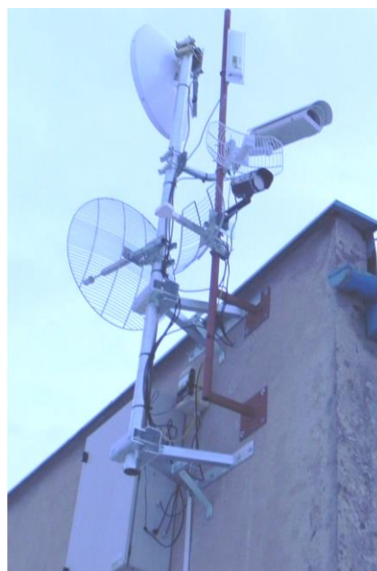
aplikácia KPS30EX v praxi