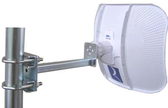
KLBE250 + 2x VBZ3 na trubke TPM