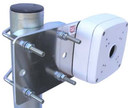
DAH122 + 2x Z85DV85 + DH-PFA121