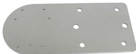
plech ( telo držiaka ) DAH122

profesionálny držiak pre uchytenie kamier DAHUA na trubku alebo stožiar vo vertikálnej alebo horizontálnej polohe