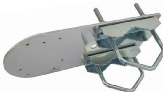
DAH122 + 2x Z85DV85