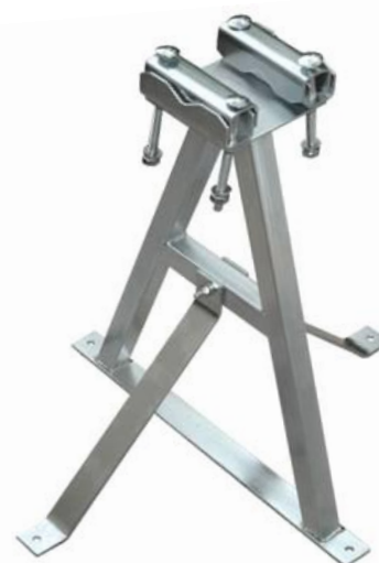
KPS50 + PPS50 + 2x 2Z5M