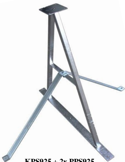
KPS925 + 2x PPS925