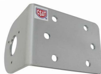
plech ( telo držiaka ) DAH90L