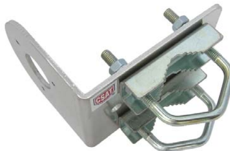
DAH90L + 2x VBZ3