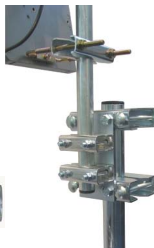
STR5 + TP1500