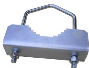
Z18M + V140