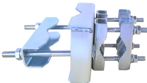
využitie Z4 pre strmeň STR3N