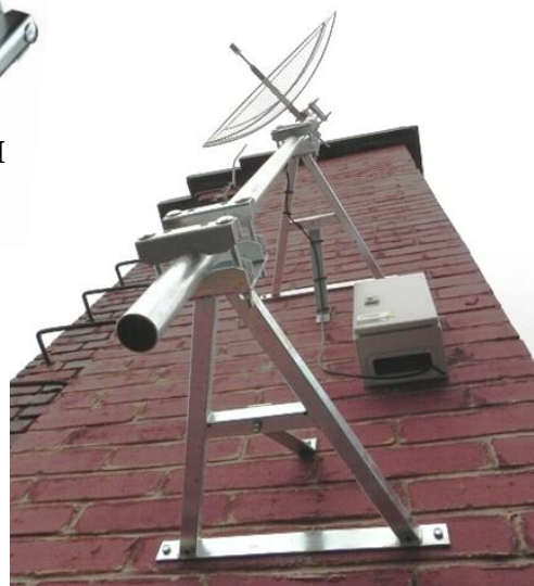
aplikácia KPS50 + PPS50 + ZZ5M

Za príplatok je možné objednať KPS s povrchovou úpravou žiarový zinok ( MAZ ), označenie v názve napr. KPS925 MAZ , pre úpravu MAZ sa poskytuje záruka 5 rokov.