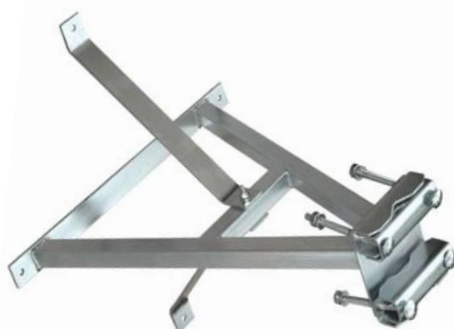
KPS50 + 2x PPS50 + 2x ZZ5M