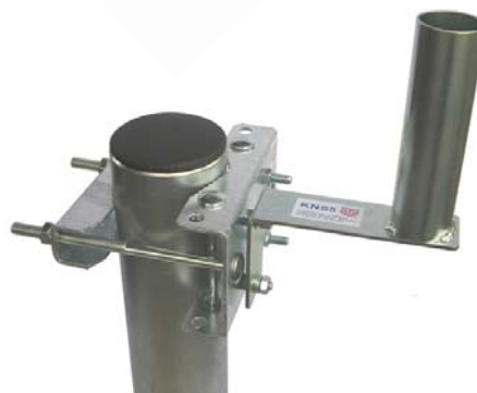
KNS5 + STR105K