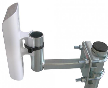
príklad použitia KML107SC