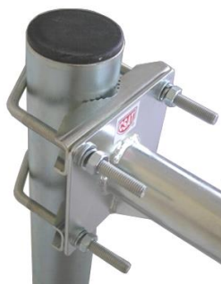
detail úchyty KS + 2x Z1V85

všetky montážne otvory majú priemer 10mm