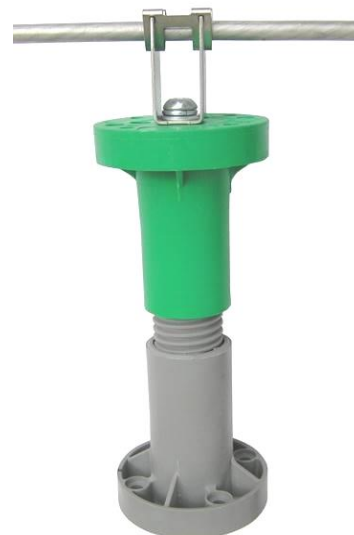
ISP100++ M8 + DEHN úchytka ( úchytka 207029 pre bleskozvod )