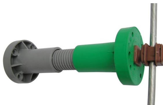
ISP100++ M8 + DEHN úchytka ( úchytka 204037 pre bleskozvod )