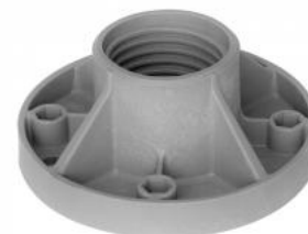
spodná časť ISP100 M8

materiál ISPonte držiaka : Fibremod™ GB364WG (polypropylén obsahujúci sklenené vlákna)