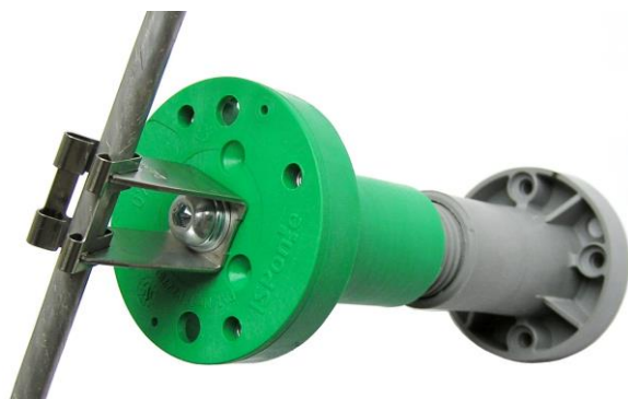
ISP100++ M8 + DEHN úchytka ( úchytka 207029 pre bleskozvod )

materiál ISPonte držiaka : Fibremod™ GB364WG (polypropylén obsahujúci sklenené vlákna)