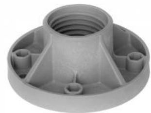
spodná časť ISP100 M8

materiál : Fibremod™ GB364WG (polypropylén obsahujúci sklenené vlákna)