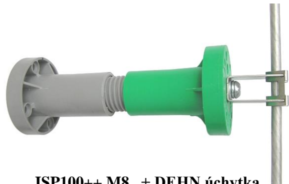
ISP100++ M8 + DEHN úchytka ( úchytka 207029 pre bleskozvod )