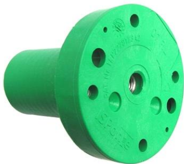
vrchná časť ISP100+ M8 ( ISP100++ M8 )

materiál : Fibremod™ GB364WG (polypropylén obsahujúci sklenené vlákna)