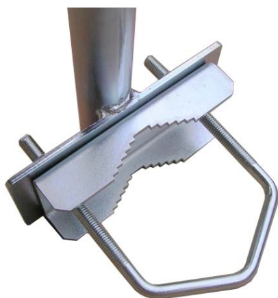
detail úchytu s Z25V85

pomocou úchytu Z25V85 alebo dvoch dvojíc žralokov Z21 ( Z21M ) je možná inštalácia na stožiar ( trubku ) s priemerom od 27 do 75mm