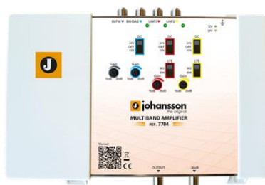
Ref. 7784 4 inputs: BI/FM, BIII/DAB, UHF1, UHF2