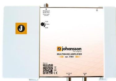
Ref. 7781 1 input: Cable