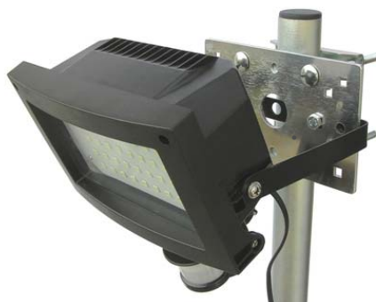
PLZ192N + LED svietidlo