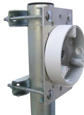
PLZ192N + DH-PAF137 ( päťica pre kamery DAHUA )